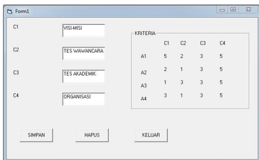
Gambar 2. Alternatif dan Kriteria