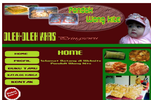
Gambar 4. Halaman Home

Tampilan halaman home merupakan suatu tampilan utama yang merupakan penggambaran dari semua halaman dan memiliki link ke semua halaman itu. Adapun implementasi tampilan halaman home yaitu: