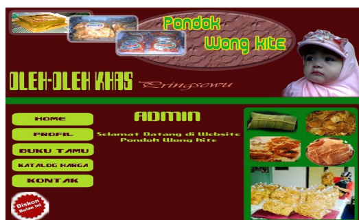
Gambar 3. Halaman Admin