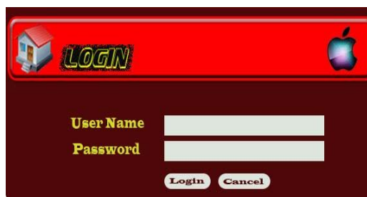
Gambar 2. Halaman Login

Halaman login digunakan oleh administrator untuk memulai memanipulasi data Usaha Mandiri, karena untuk memanipulasi data website, seorang administrator harus login terlebih dahulu. Adapun halaman login ditunjukkan pada gambar berikut: