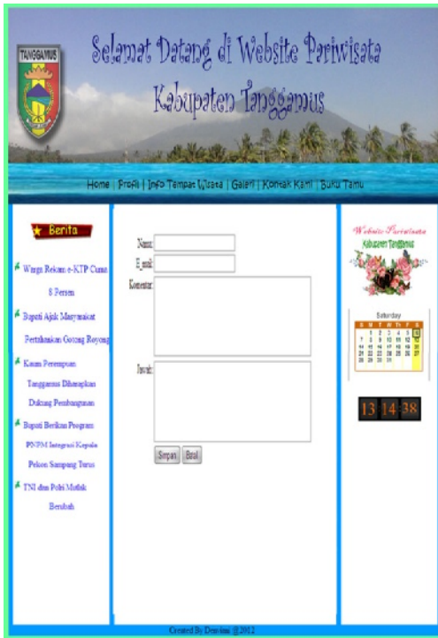
Gambar 8. Halaman Input Buku

Dibawah ini merupakan form input buku tamu yang dapat diisi oleh pengunjung (user) Website Pariwisata Kabupaten Tanggamus.