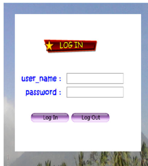
Gambar 3. Halaman Login

user_name dan password yang harus diinputkan oleh admin sebelum masuk ke halaman admin untuk melakukan manipulasi data.