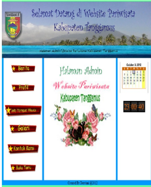
Gambar 4. Halaman Admin

Dibawah ini merupakan halaman admin yang akan digunakan oleh admin untuk memanipulasi data.