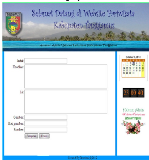
Gambar 5. Halaman Admin – Input Berita

Dibawah ini merupakan halaman admin – input berita yang berisi form input berita yang akan digunakan oleh admin untuk meng-update berita terbaru.