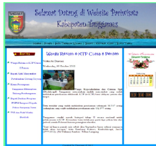
Gambar 7. Halaman Home

Dibawah ini merupakan halaman home yang menampilkan semua menu yang ada dalam Website Pariwisata Kabupaten Tanggamus yang akan memberikan informasi kepada pengunjung (user).