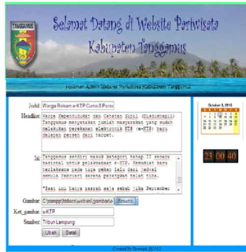
Gambar 6. Halaman Admin – Edit Berita

Dibawah ini merupakan halaman Admin – Edit Berita yang akan digunakan oleh admin untuk mengubah berita yang sudah di simpan.