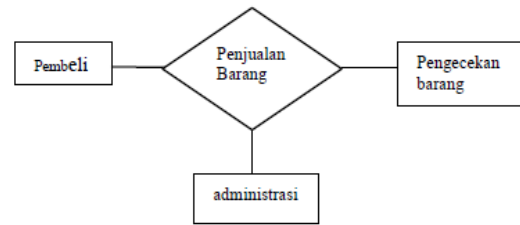
Gambar 1. Entity Relationship Diagram