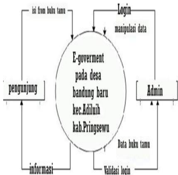
Gambar 4.1. Diagram Konteks

Diagram konteks merupakan diagram yang menggambarkan suatu sistem beserta seluruh eksternal entity yang terlibat dalam sistem yang disertai dengan aliran data yang digunakan atau diperlukan (hanya terlibat satu proses).