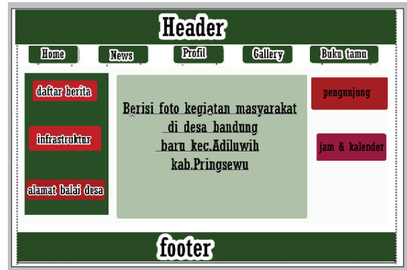
Gambar 4.6.4 Implementasi Halaman Gallery