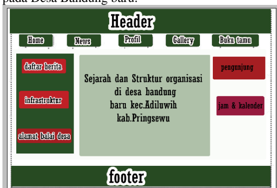
Gambar 4.6.3 Implementasi Halaman Profil

Halaman profil berisi tentang sejarah singkat terbentuknya Desa Bandung baru, struktur pemerintahan, dan letak geografis Desa Bandung baru. Rancangan menu profil dalam E-Government pada Desa Bandung baru.