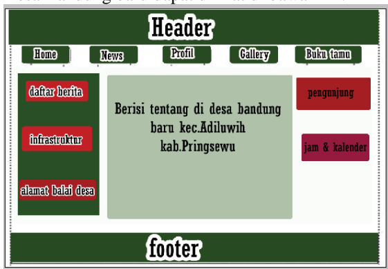
4.6.2. Implementasi Halaman Berita

Halaman menu berita berisi tentang berita-berita terbaru khususnya di Desa Bandung baru. Rancangan menu berita dalam E-Government pada Desa Bandung baru dapat dilihat di bawah ini: