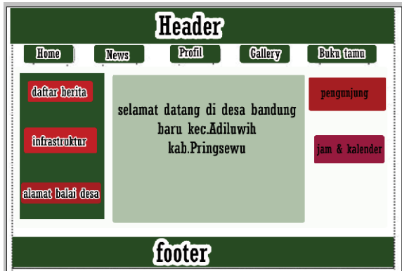
4.6.1 Implementasi Halaman Home