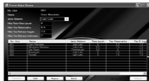
Gambar 4.2. Tampilan Form Data Siswa

Pada form ini berisi tempat pengisian data siswa