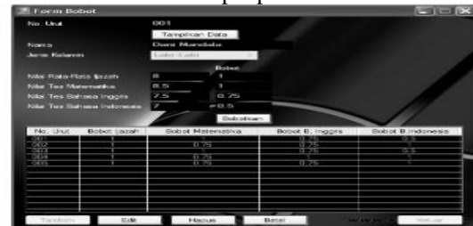
Gambar 4.3. Tampilan Bobot