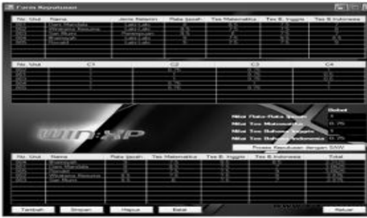
Gambar 4.4. Tampilan Perusahaan

Pada form ini berisi tempat pengisian data Sekolah